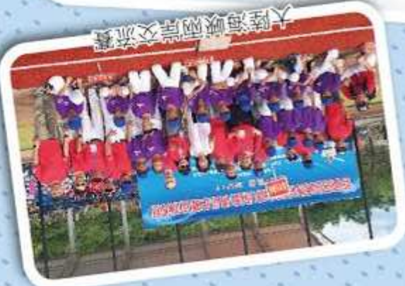
大陸海峽兩岸交流賽