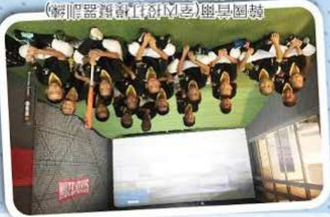
韓國首爾(室內投打模擬器訓練)韓國首爾台韓交流賽