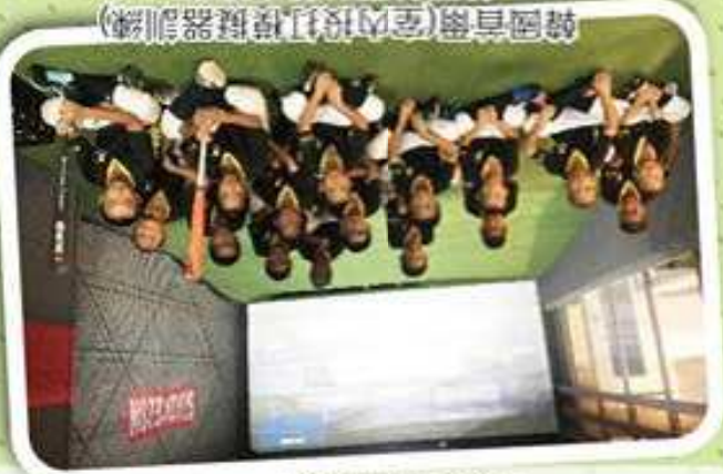
韓國首爾(室內投打模擬器訓練)